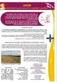
Système alimentaire métropolitain durable