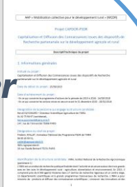
Apports recherche aux acteurs