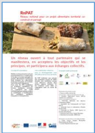
Projet Alimentaire Territorial